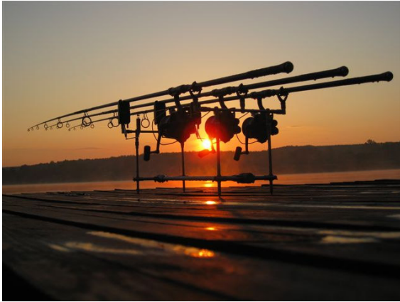
Sonnenaufgang auf Swim 4