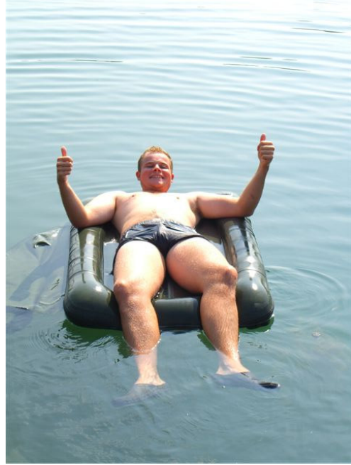
Was eine Pelzer Abhakmatte sooo alles aushält!!