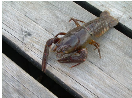
Der Krebs kam übrigens NICHT in den Kochtopf