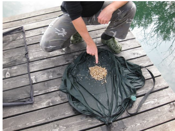
Der Karpfensack mit einer Ladung „gemahlener“ Tigernüsse