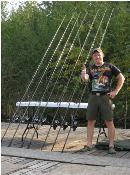
Christian mit den geladenen „Haubitzen“