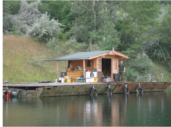
Swim 4 mit Christian vor der Hütte